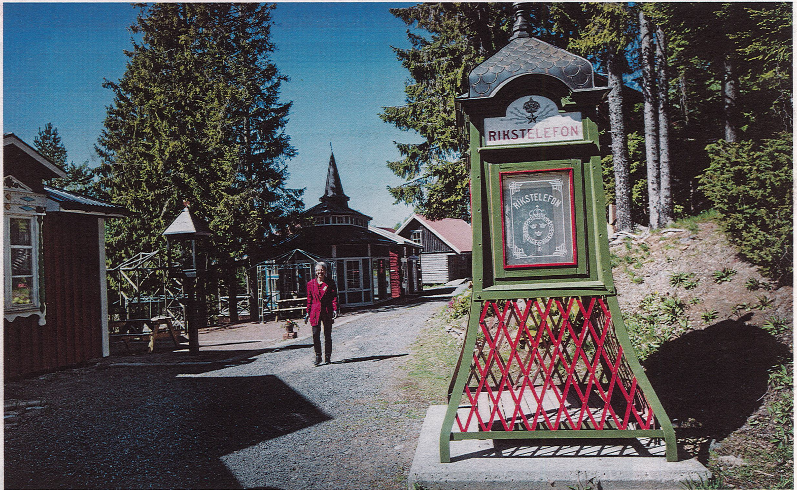
Telefonkiosken är en replik av en äldre modell.